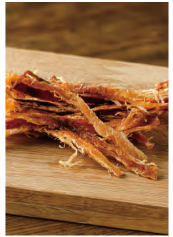
北海道産 いかオリーブオイル&ガーリック

北海道近海で漁獲された新鮮なスルメイカを、旨味を逃さぬように皮をつけたまま、焼きたてを裂きました。刺激を求めて唐辛子、ガーリック、本場イタリアのオリーブオイルを調味に使い、ソフトに仕上げたおつまみです。