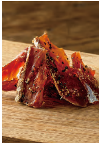
北海道産 サーモンのひと口とば 黒胡椒

北海道産の良質な秋鮭を原料に、背骨を取り除き、3枚におろしてから食べやすいように皮を剥いてから、乾燥させました。刺激を楽しむようにブラックペッパーを隠し味に使用しています。昆布・鰹・椎茸を使用した出汁で調味したひと口サイズのおつまみです。