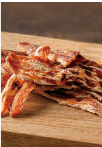
北海道産 黒酢で漬けたスルメイカ

北海道近海で漁獲された新鮮なスルメイカを、旨味を逃さぬように皮をつけたまま、焼きたてをスティック状に裂きました。国産の玄米を使用したやわらかな酸味の米黒酢を調味に、ソフトに仕上げたおつまみです。