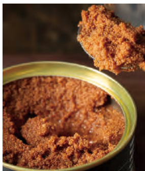
北海道根室の真鱈子 甘辛煮

北海道根室産の真だらを新鮮なうちにさばいた「真だらこ」を、北海道産の醤油と砂糖で味付けしました。真鱈は魚偏に雪と書く通り、冬季に漁が本格化します。ご飯のおともに、お酒の肴に最適な、北の海の幸がたっぷり詰まった一缶です。