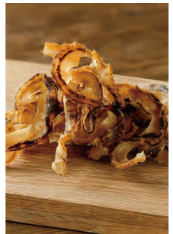
北海道産 帆立貝の焼きひも

北海道沿岸で獲れた新鮮な帆立貝の貝ひもを、旨味を引き立たせるよう昆布、鰹、椎茸の出汁で味付けしたこだわりの逸品です。