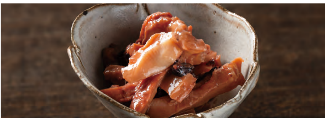
北海道噴火湾産 たこやわらか煮

味が濃いと言われる北海道産のたこを一口サイズにカットし、柔らかくなるまで「直火釜炊き製法」でじっくりと炊き上げました。たこを炊くタレに昆布出汁の旨味を加えた、嗜めば嗜むほど奥深い旨さがお楽しみいただける逸品。