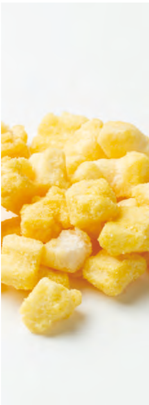
北海道産もち米使用 北のおかき 美瑛のとうもろこし

お茶のおともにぴったりな米菓子。 北海道産100%のもち米と北海道を代表する 食材をあつめて作りました。