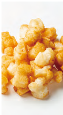
北海道産もち米使用 北のおかき 旭川の醤油

北海道産100%の餅米と、味付には旭川市で製造している醸造しぼりたての酵素が生きている醤油を使用しています。醤油の香ばしい香りと味は、とてもまろやかです。