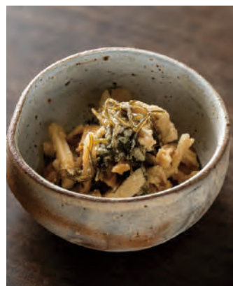
北海道産 大根の昆布醤油漬け 山わさび

北海道産極太切干大根と山わさびパウダー、日高産細切り昆布、北海道産昆布だしつゆが入った漬物が作れるキット。袋の中で漬けておくだけで、ツーンとした辛味の漬物がお楽しみいただけます。