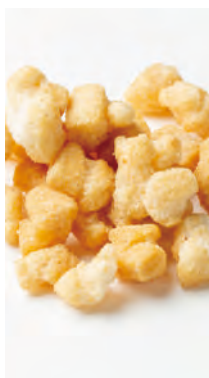
北海道産もち米使用 北のおかき 標津の鮭

北海道産100%の餅米と北海道で有名な標津産鮭節を使用し、餅をつく時に鮭節を入れ、味付けの際にさらに鮭節を振り、塩で味付けをした深みのある味わいをお楽しみいただけます。