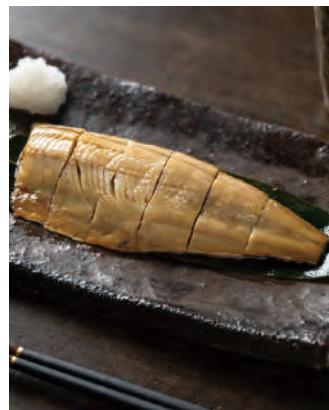
北海道産 焼きほっけ 根室魚醬仕上げ

北海道で水揚げされたホッケを魚醬と昆布塩で味付し、焼き上げてひと口大にカットしました。根室独自の製法で作られたほっけ魚醬を使用し素材の旨みを引き出した、ご飯のおかずにもお酒の肴にもぴったりの逸品です。