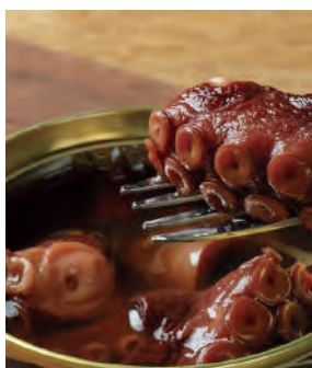
北海道根室の銀だこ やわらか煮

寒い海域に生息する柳だこは、太平洋側での漁獲が水揚げの80%以上を占め、根室では「銀だこ」の相性で親しまれています。その銀だこを、根室で人気のほまい昆布醤油と砂糖で甘辛く味付けし、歯ごたえのある柔らかさに仕上げました。