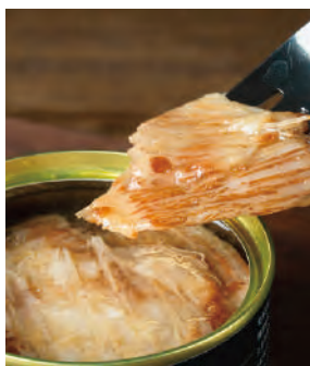
銀ガレイえんがわ醤油煮 (※銀ガレイ:ロシア産又はアイスランド産)

北海道の根室で鳥ガレイは別名「銀ガレイ」と呼ばれています。銀ガレイの「えんがわ(縁側)」は寿司ネタとしても人気です。脂が乗っていてコリコリとした食感のえんがわを、北海道産の醤油と砂糖で甘辛く味付けしました。