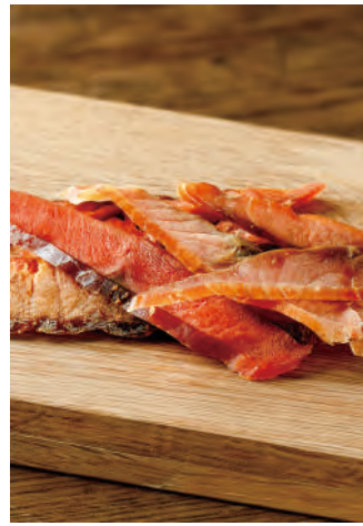
北海道産 サーモンの薄切りとば

北海道沖で漁獲された鮭の皮を取り除き、ソフトで食べやすくスライスしました。素材本来の味をそのまま活かし、さらに昆布・鰹・椎茸を使用したこだわりの出汁を加え、旨味をアップしました。