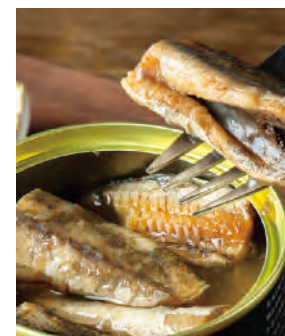
北海道の氷下魚 唐辛子水煮

北海道の冬の海で獲れる「氷下魚(こまい)」。氷に穴を開けて漁獲をする「氷下待ち網漁」は道東の冬の風物詩。一夜干しなどで酒の肴として好まれるこの氷下魚を唐辛子を入れて水煮にしました。マヨネーズやお醤油との相性も抜群です。