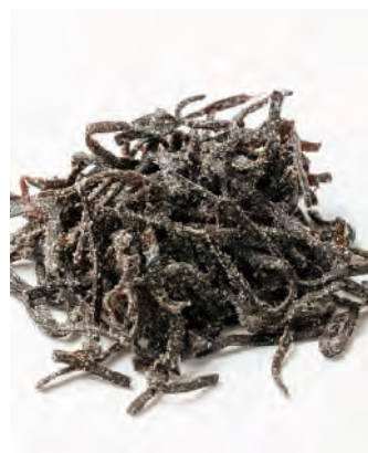
北海道産 汐こんぶ

北海道産の塩・昆布を使って作った、旨味溢れるご飯のお供です。おにぎりの具材、お茶漬けにもお使い頂けます。