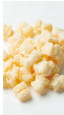
北海道産もち米使用 北のおかき オホーツクの塩

北海道産100%の餅米とオホーツク産塩のみを使用し、美味しさと味が十分満足頂けるおかき基本の味わいです。カラッと軽い食感に揚げることで素材が持つ美味しさをより引き出し、サクサクとあっさりとした食べ心地です。