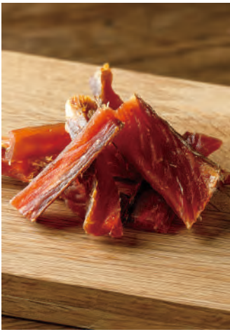
北海道産 サーモンのひと口とば

北海道産の良質な秋鮭を原料に、背骨を取り除き、3枚におろしてから食べやすいように皮を剥いて、乾燥させました。昆布・鰹・椎茸を使用したこだわりの出汁で調味したひと口サイズのおつまみです。