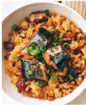
北海道産さんま使用 炊き込みご飯の素(さんま)

北海道産のサンマを一度塩焼きすることで青魚特有の臭いも気にならない、秘伝のタレを使用したさんまの炊き込みご飯の素。骨まで柔らかく食べられ、塩焼きさんまの風味がよりおいしさを増します。