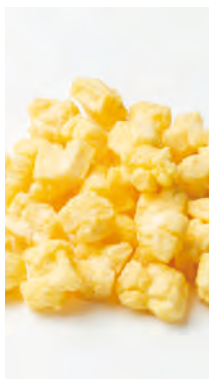
北海道産もち米使用 北のおかき 佐呂間のかぼちゃ

北海道産100%の餅米と、北海道佐呂間産のかぼちゃを使用し、かぼちゃの甘みを存分に味わえるおかきです。北海道を代表する食材をフレーバーに加工し、新鮮な美味しさを引き出す逸品です。