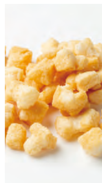
北海道産もち米使用 北のおかき 富良野の玉ねぎ

北海道産100%の餅米と北海道富良野地方産の玉ねぎを使用し、玉ねぎの旨みと甘みを思う存分楽しめる味わいです。北海道を代表する食材をフレーバーに加工し、美味しさを引き出した逸品です。