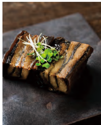
北海道産昆布使用 鯨と昆布の重ね巻き

脂の乗ったニシンと北海道産昆布をミルフィーユのように重ね合わせ、真空圧力釜にてじっくり炊き上げました。素材と製法にこだわり、薄味に仕上げました。昆布とニシンの絶妙な味をご堪能下さい。