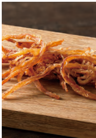
北海道産 手焼きささいか 唐辛子

北海道近海で漁獲された新鮮なスルメイカを、旨味を逃がさぬように皮をつけたまま、焼きたてを細かく裂きました。サンマ魚醤を隠し味に使い、こだわりの唐辛子をまぶしたピリ辛のおつまみです。