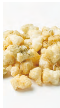
北海道産もち米使用 北のおかき 函館のがごめ昆布

北海道産100%の餅米と北海道函館産のがごめ昆布を使用し、餅のがごめ昆布を練り込み、味付けにもがごめ昆布を使用しました。昆布の味がさわたく逸品です。