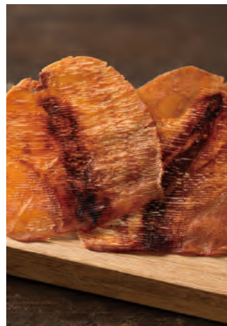
北海道産 やわらかのしいか さんま魚醤

北海道近海で漁獲された新鮮なスルメイカを、旨味を逃さぬように皮をつけたまま、焼きたてをソフトにのしました。根室でとれた鮮度の良いサンマを原料にした、特上の魚醤が隠し味です。